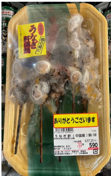
写真①：正しい表面ラベル